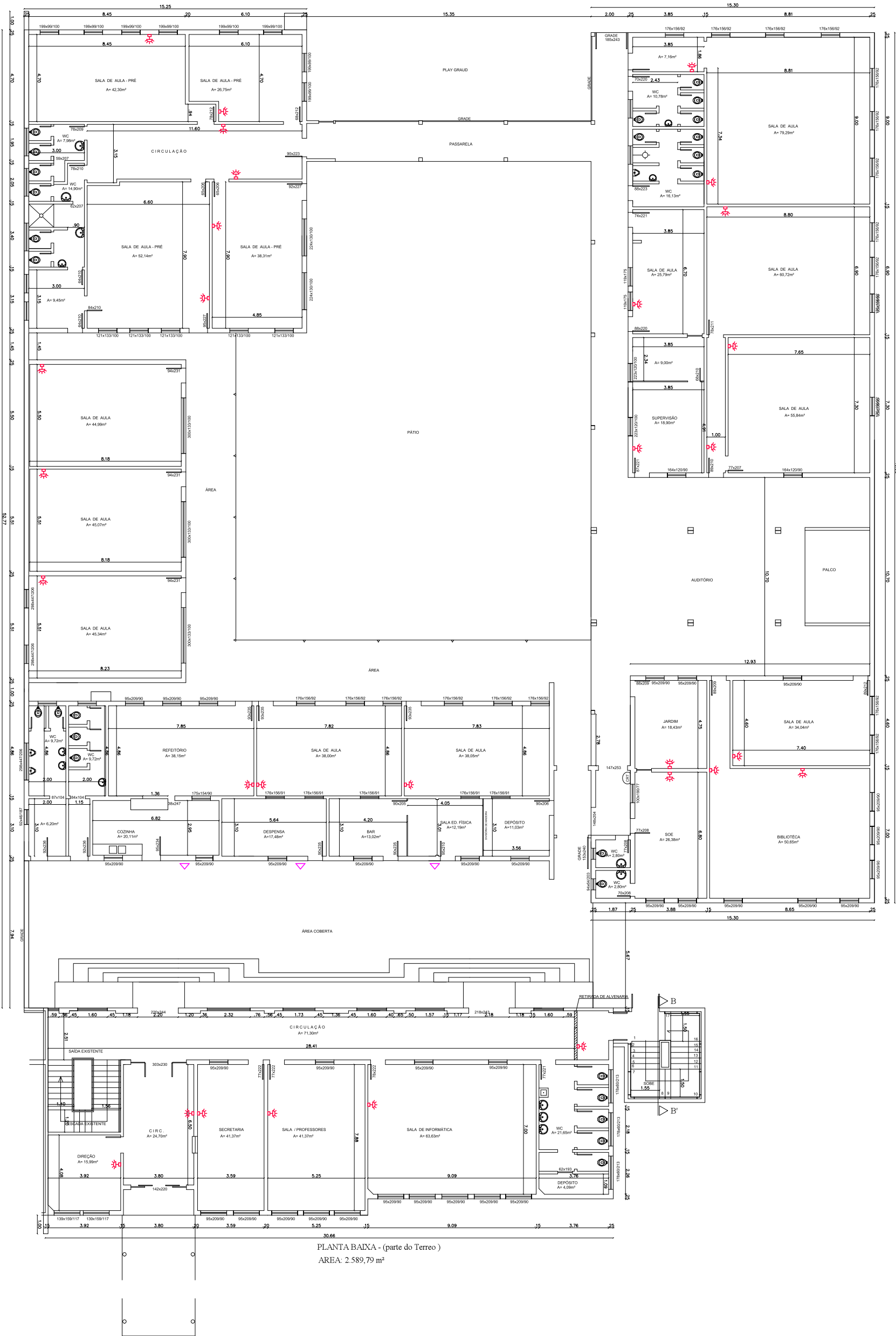
PLANTA BAIXA - (parte do Terreo ) ÁREA: 2.589,79 m²