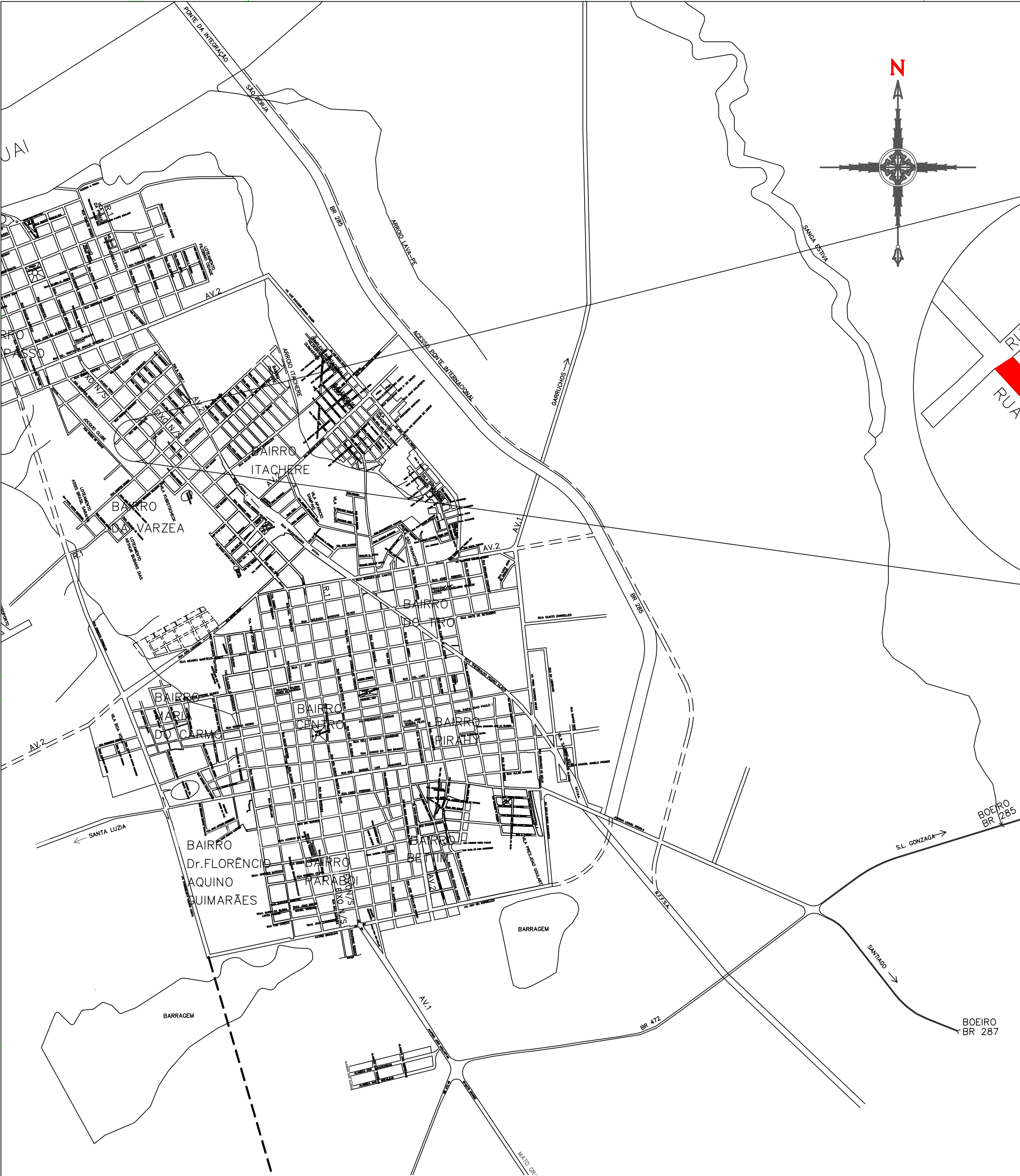
PLANTA DE SITUAÇÃO E LOCALIZAÇÃO ESC 1/5000

COORDENADAS GPS INÍCIO DO TRECHO: ESQ COM RUA GENERAL HIPÓLITO COORDENADAS GPS FIM DO TRECHO: ESQ COM RUA TUIUTI