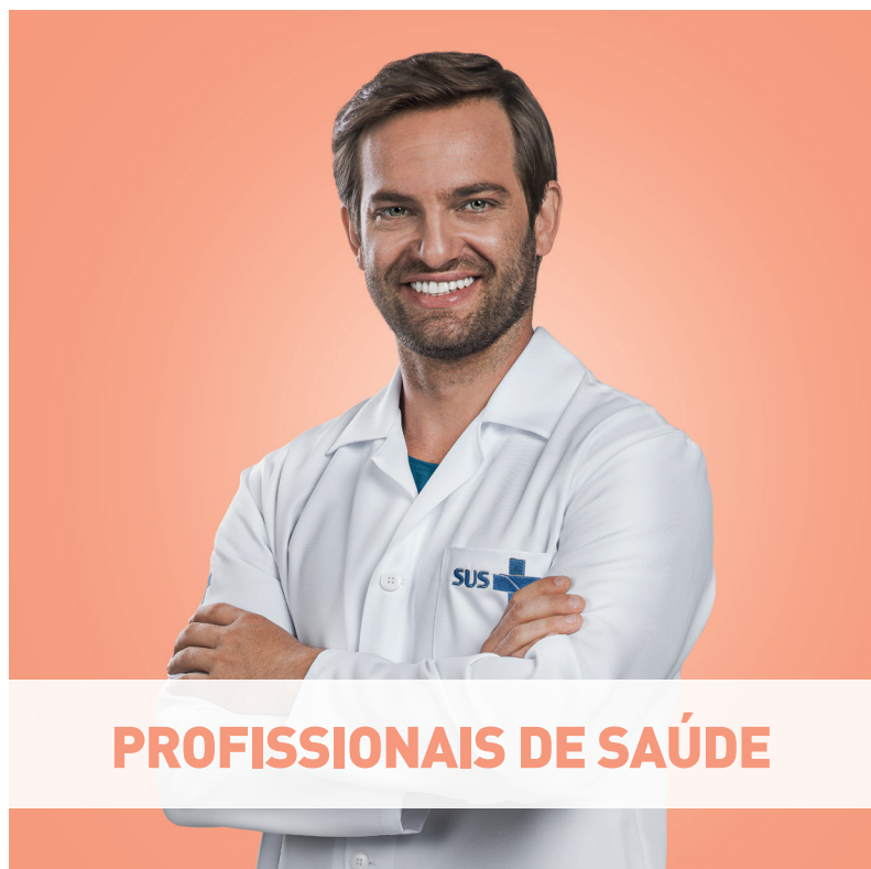
PROFISSIONAIS DE SAÚDE