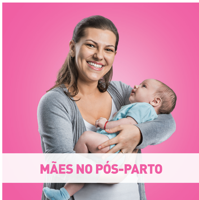
MÃES NO PÓS-PARTO