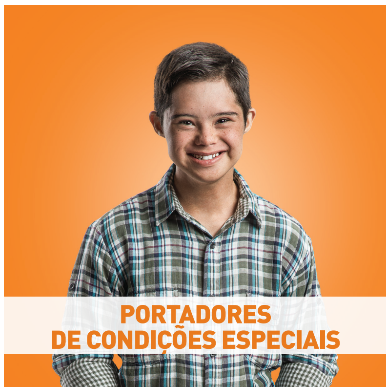
PORTADORES DE CONDIÇÕES ESPECIAIS

SÁBADO 13 DE MAIO DIA DA MOBILIZAÇÃO NACIONAL CONTRA A GRIPE.