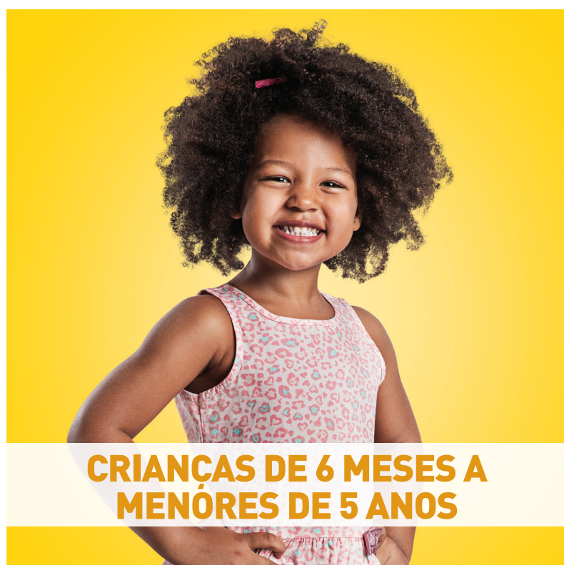
CRIANÇAS DE 6 MESES A MENORES DE 5 ANOS