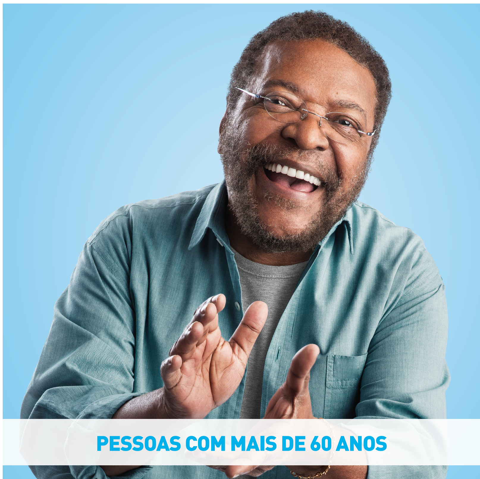
PESSOAS COM MAIS DE 60 ANOS